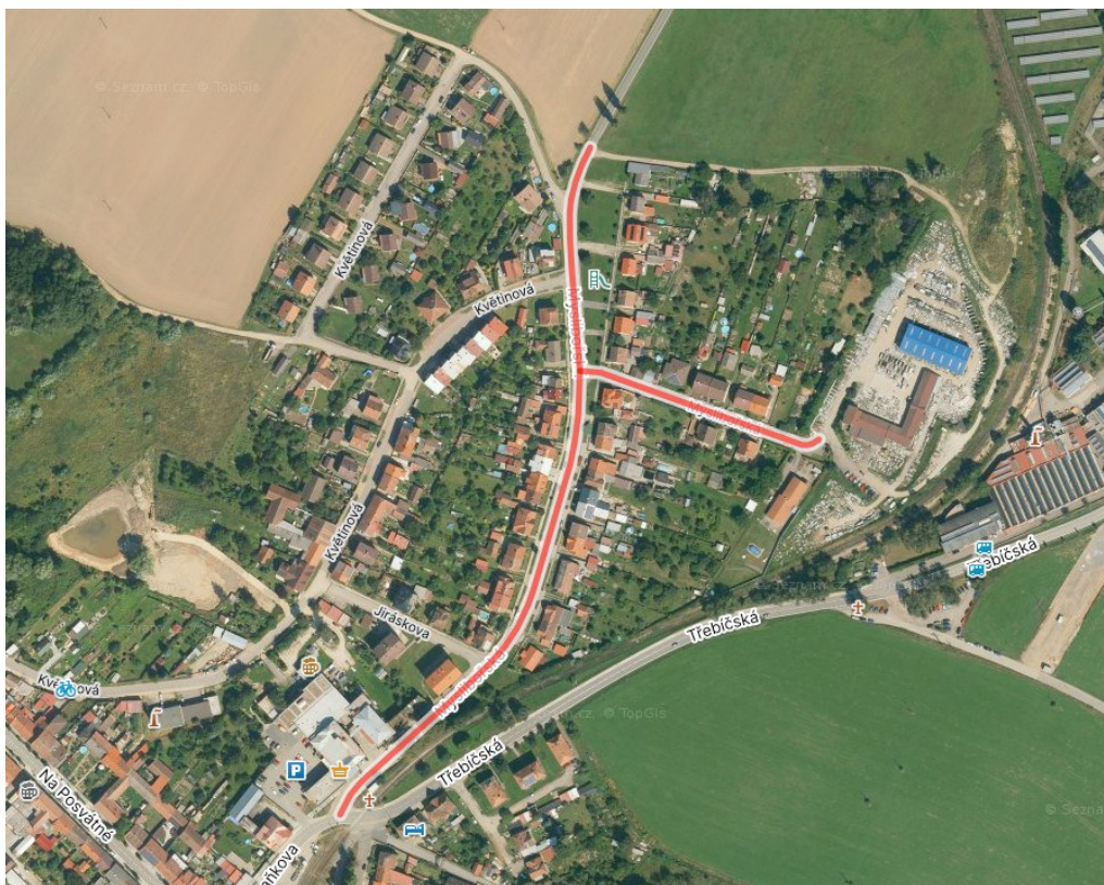
Obr. 1. Letecký pohled s označením předmětné ulice, zdroj Mapy.cz.